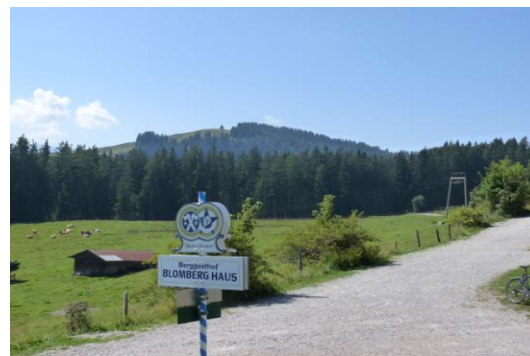
Blick vom Blomberghaus zum Zwieselberg