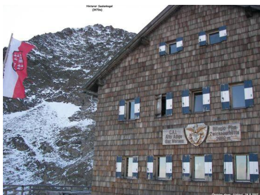
Zwickauer Hütte – Hinterer Seelenkogel