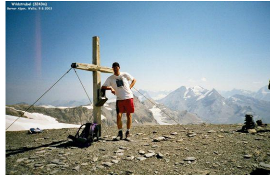
Auf dem Gipfel des Wildstrubel