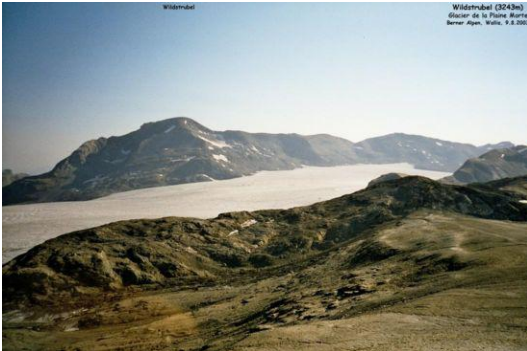
Blick zum Glacier de la Plaine Morte Links der Wildstrubel