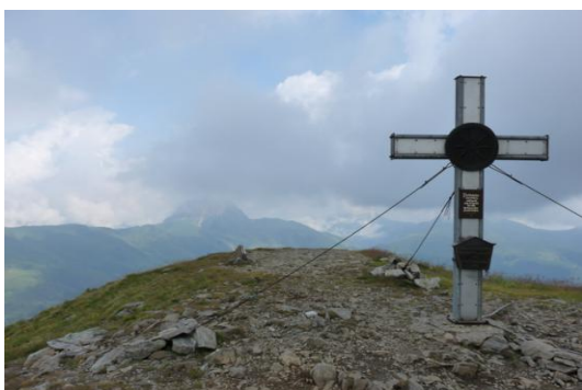
Wildkogel (Hinten der Große Rettenstein)