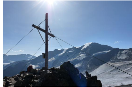
Am Gipfel. Blick zur Weißseespitze