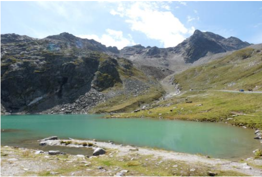
Am Weißsee. Blick zum Wiesjagglkopf (rechts)