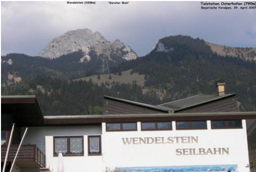
Wendelstein (Blick Talstation Seilbahn)