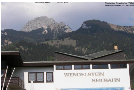
Wendelstein (Blick Talstation Seilbahn)