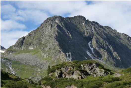
Vordere Sommerwand (Blick unterhalb der Franz-Senn-Hütte)