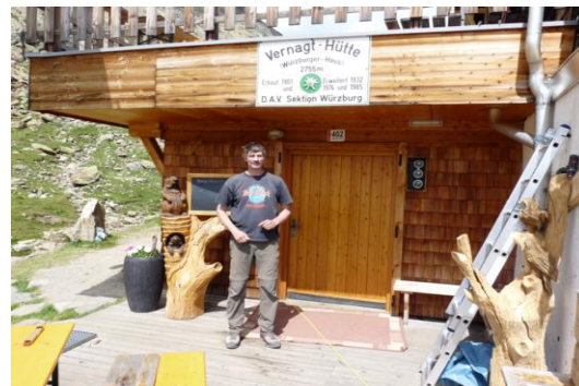
Vernagthütte - Eingang