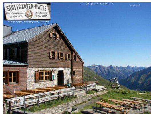
Stuttgarter Hütte am Krabachjoch