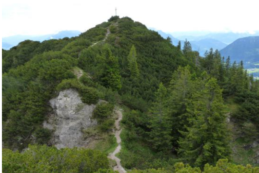
Trainsjoch (Blick vom Westgrat)