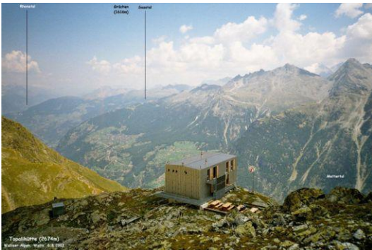
Topalihütte über dem Mattertal