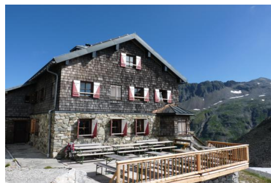
St. Pöltner Hütte