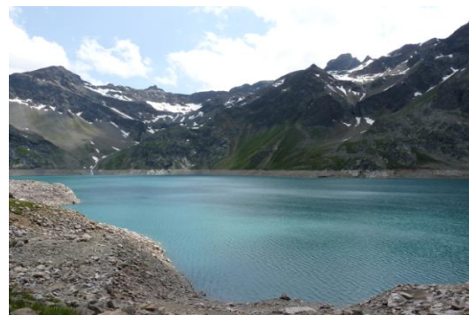
Speicher Finstertal (Rechts hinten der Sulzkogel)