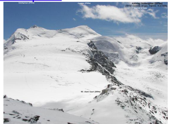
Blick Zufallspitzen - Cevedale