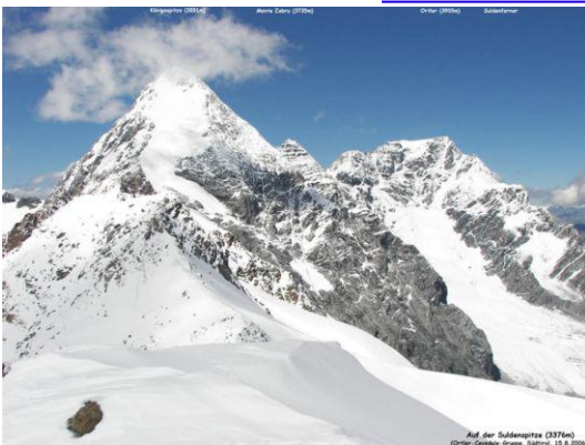
Blick Königsspitze - Ortler