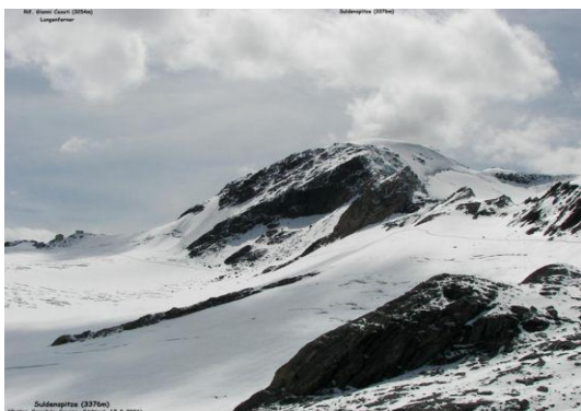
Suldenspitze – Cima di Solda