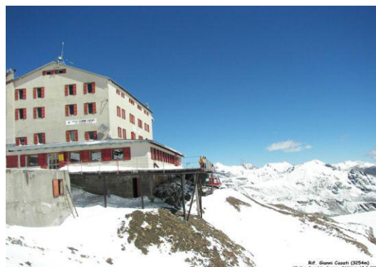
Casatihütte – Rifugio Gianni Casati