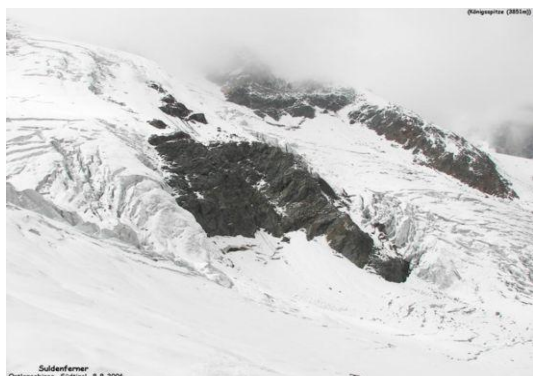
Suldenferner – Ghiacciaio di Solda