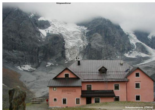
Schaubachhütte – Rifugio Citta di Milano