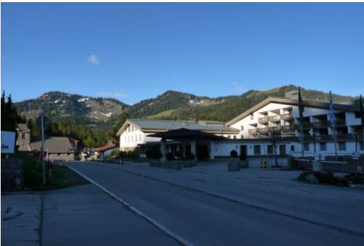
Stolzenberg – Rotkopf - Roßkopf