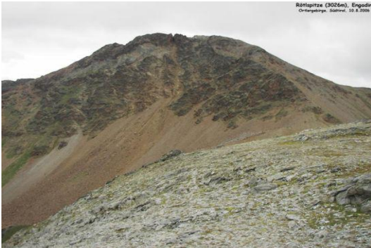
Rötlspitze – Punta Rosa