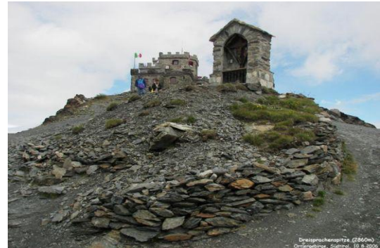
Dreisprachenspitze – Cima Garibaldi