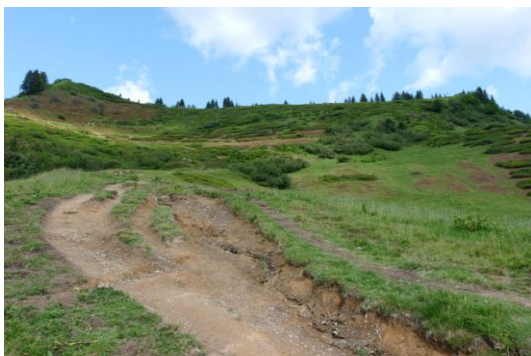
Anderl Heckmair Gedächtnis-Pfad (Blick zum Söllereck-Grat)