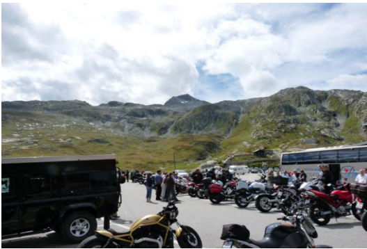
Grimselpass mit Sidelhorn (Mitte)