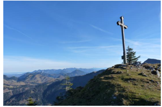
Blick in die Chiemgauer Alpen