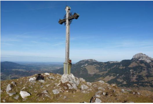
Blick ins Alpenvorland und Wendelstein