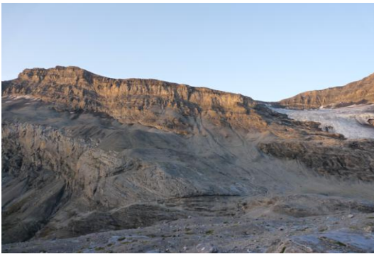
Schwarzhorn (links) Lämmerengletscher (rechts)