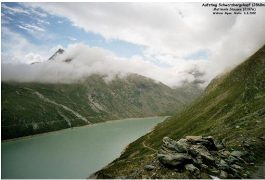
Aufstieg zum Schwarzbergchopf Blick zum Mattmarkstausee