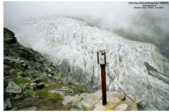
Am Schwarzbergchopf Blick zum Allalingsletscher