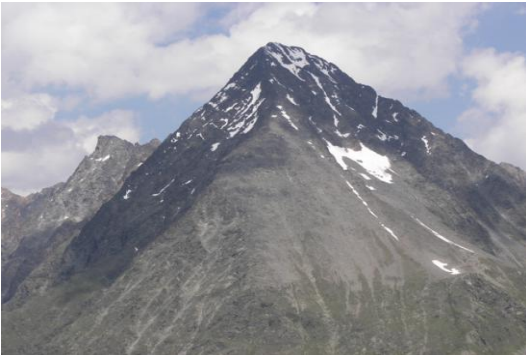
Schrankogel (Blick vom Aufstieg zur Kuhscheibe)