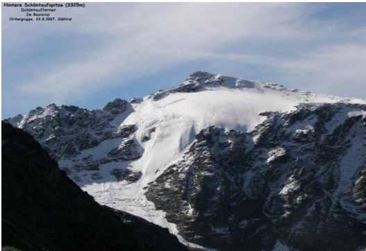
Hintere Schöntaufspitze (Schöntaufferner)