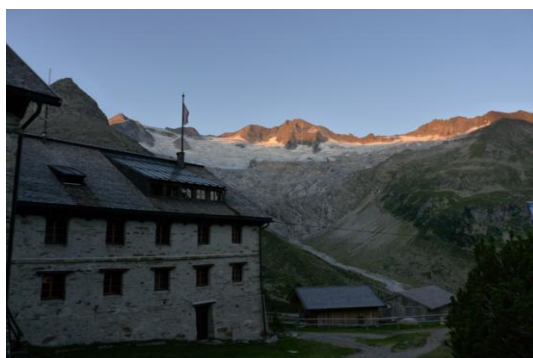
Berliner Hütte / Hinten: Großer Möseler