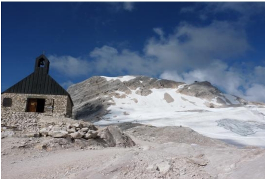
Schneefernerkopf (vom Sonn Alpin)