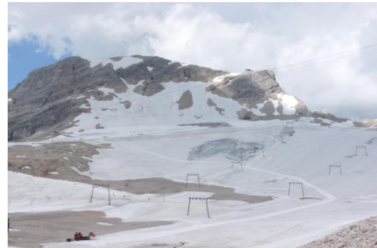
Schneefernerkopf – Nördlicher Schneeferner