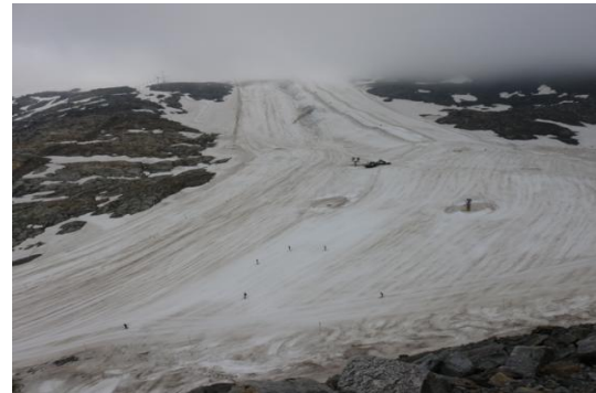
Mölltaler Gletscher (Blick Eisseebahn 2800m)