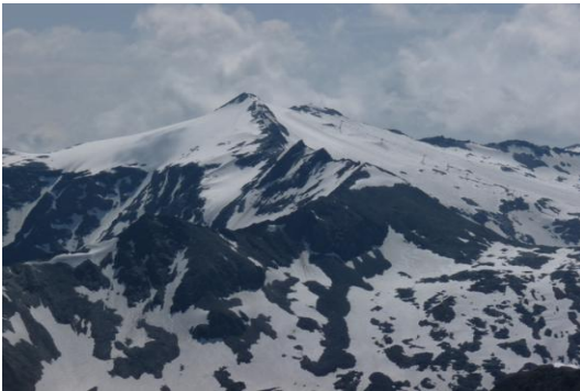
Schareck (Blick von der Goldzechscharte im Juli 2009)