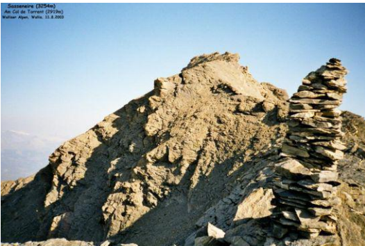
Sasseneire (Blick vom Col de Torrent)