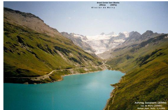
Lac de Moiry – Glacier de Moiry