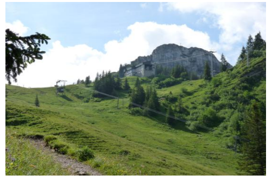
Taubenstein (mit Taubensteinbahn)