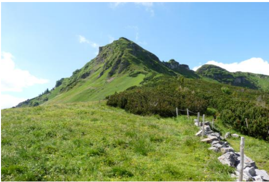
Rotwand (vom Miesingsattel, 1705m)