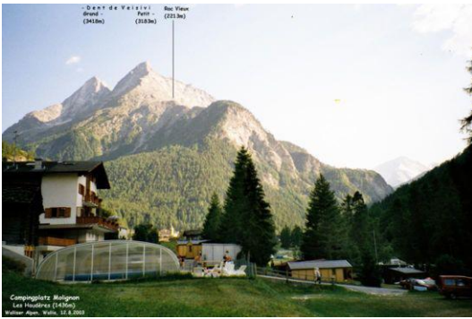
In Les Haudères (Val d' Hérens) Blick zum Roc Vieux