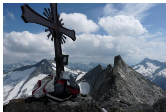
Richterspitze (Gipfel) – Blick nach Süden