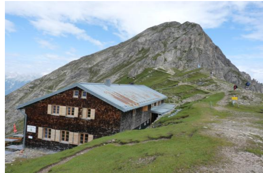
Nördlinger Hütte (mit Reither Spitze)