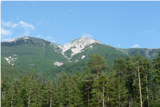
Reither Spitze (vom Seefelder Sattel)