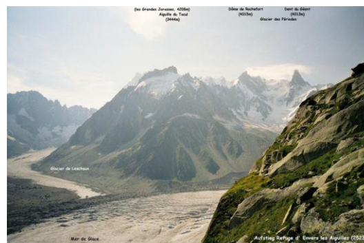
Aufstieg zum Refuge d' Envers les Aiguilles Mer de Glace