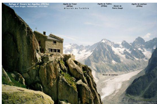
Refuge d' Envers les Aiguilles Glacier de Leschaux