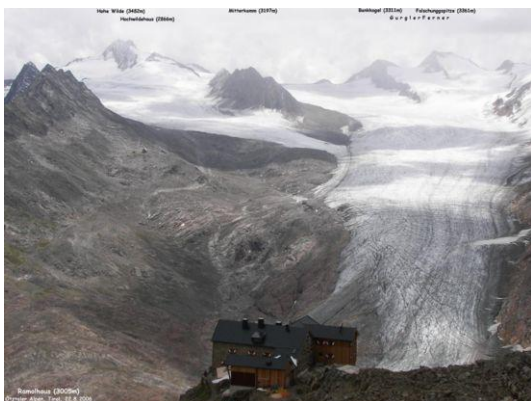
Ramolhaus – Gurgler Ferner