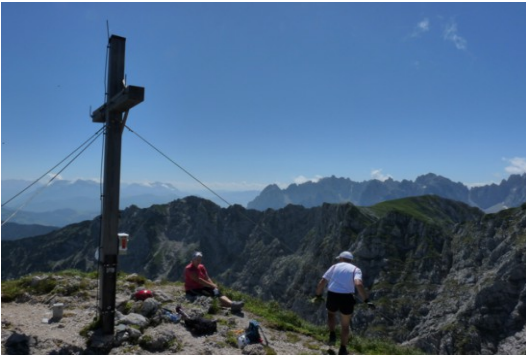
Blick zum Wilden Kaiser