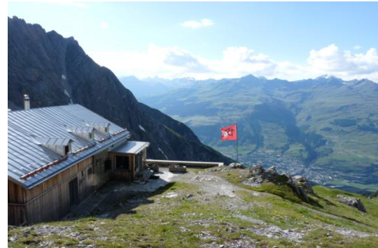
Lischanahütte (Chamonna Lischana) Blick nach Scuol