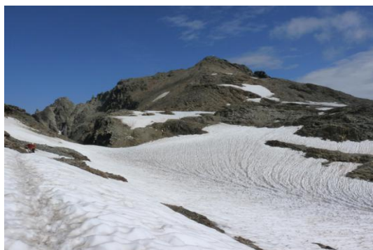
Petzeck – Das Gipfelschneefeld