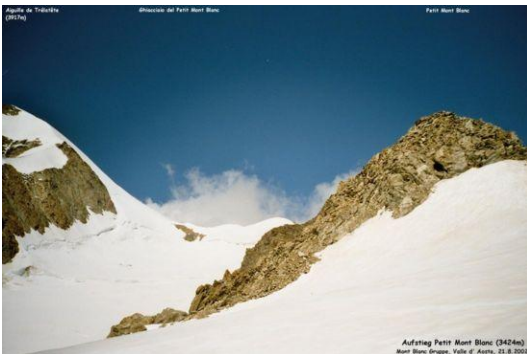
Petit Mont Blanc (rechts) Aiguille de Trélatête (3917m, links)