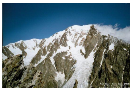
Der Blick auf den Mont Blanc