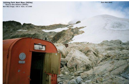
Bivaccio Gino Rainetto Gletscher auf den Petit Mont Blanc