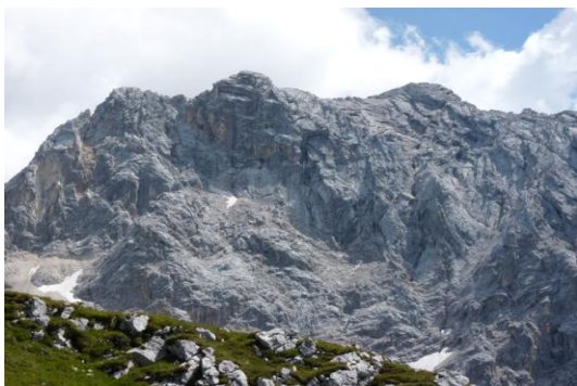
Partenkirchner Dreitorspitze (Westgipfel rechts)