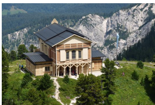
Königshaus am Schachen