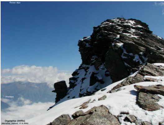
Orgelspitze – Punta di Lasa