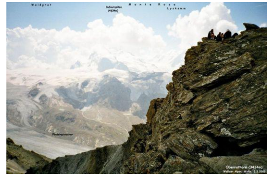
Auf dem Oberrothorn (Blick zur Monte Rosa Gruppe)