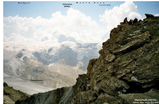
Auf dem Oberrothorn (Blick zur Monte Rosa Gruppe)