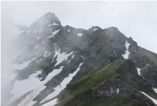
Niedersachsenhaus (Grat zur Herzog-Ernst-Spitze)