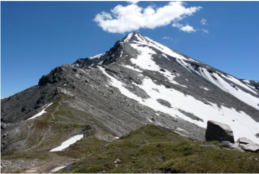
Der Muttler vom Rossbodenjoch (ca. 2800m)