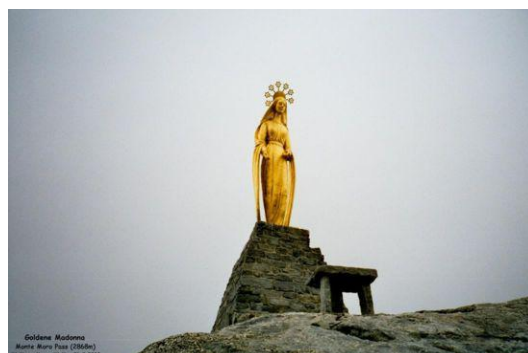
Goldene Madonna am Monte Moro Pass