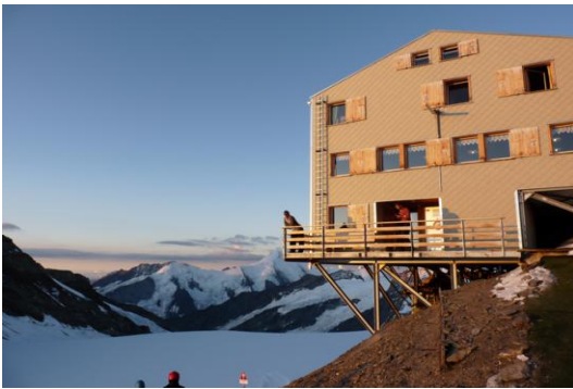
Mönchsjochhütte bei Sonnenaufgang