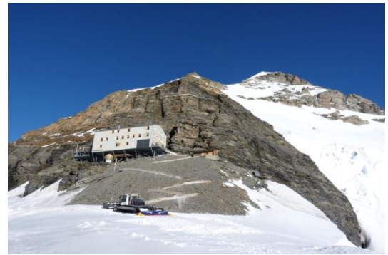
Mönchsjochhütte mit Mönch (vom Oberen Mönchsjoch)