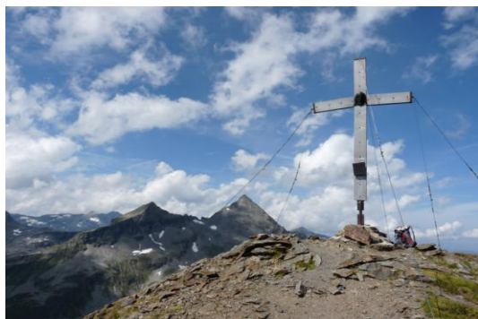
Messelingkogel (hinten der Tauernkogel)