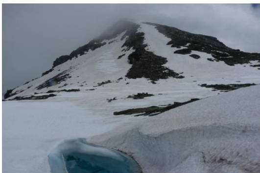
Medelzkopf mit Medelzlake