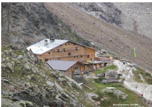
Martellerhütte – Rifugio Martello