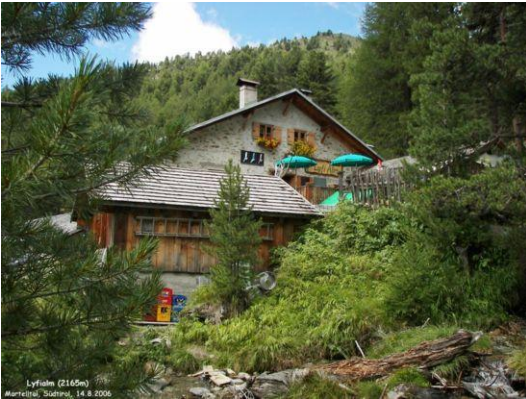
Lyfialm – Malga Lifi