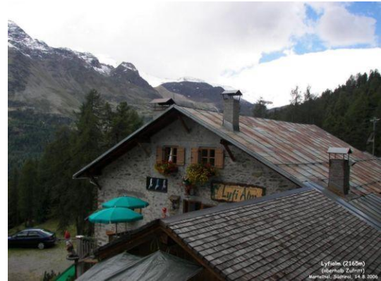
Lyfialm – Malga Lifi