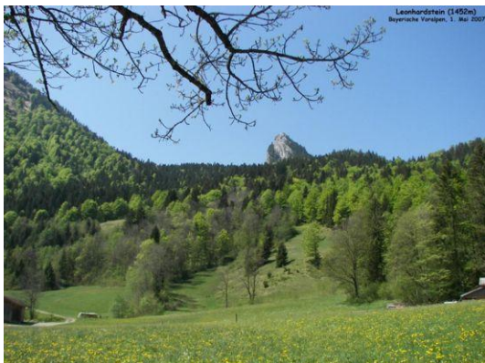
Leonhardstein (Blick von Kreuth)